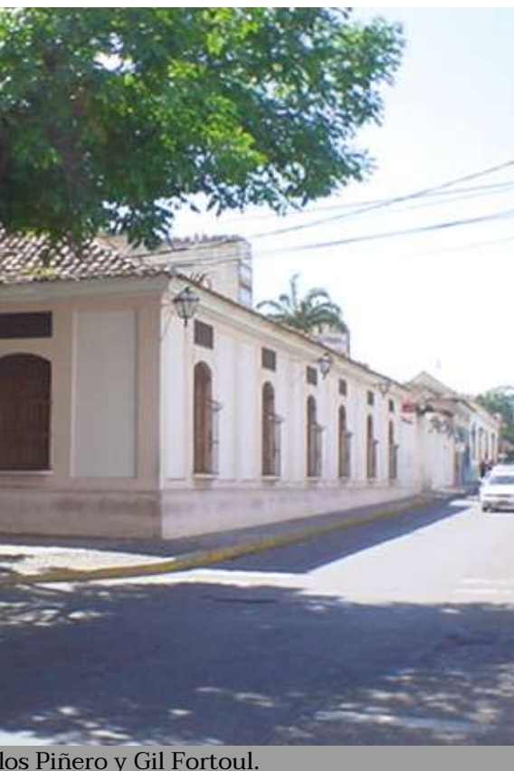
los Piñero y Gil Fortoul.