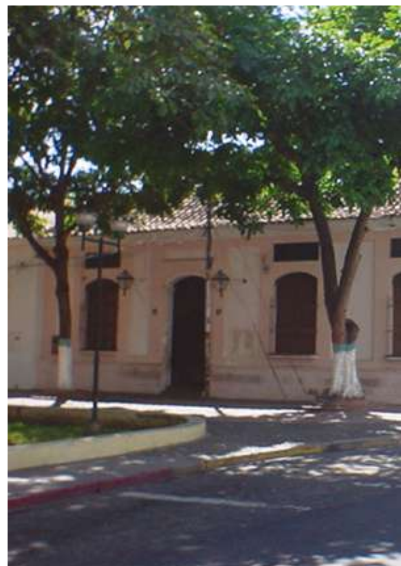
Fue hogar de ilustres familias larenses, como

A mediados del siglo XIX nace la génesis del estado Lara, la Provincia de Barquisimeto en el año