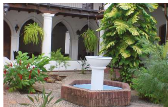
Su patio central ha sido testigo de reuniones solemnes y sociales.

Allí se encuentra el archivo central del Consejo Legislativo del Estado Lara, el cual se ha convertido en un importantísimo referente de la historia parlamentaria de la entidad, dando mayor relevancia a la casona rosada como patrimonio cultural e histórico de los larenses que al momento de escribir este artículo es sometida a una nueva restauración para ser sede alterna de la Feria Internacional del Libro de Venezuela (FILVEN 2024).