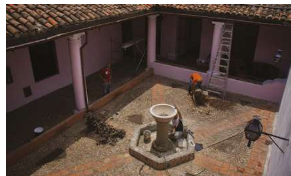
Reparaciones en desarrollo.